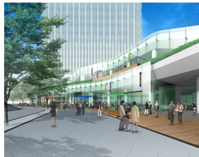
ThinkPark Plaza (仮称)